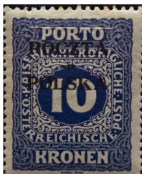
Rys. 31. Najdroższy znaczek Polski Fig. 31. The most expensive stamp of Poland

Na koniec chciałbym pokazać najdroższe znaczki polskie i zagraniczne. Ich wartości są uzależnione przede wszystkim od rzadkości występowania. Najdroższym znaczkiem polskim jest krakowski nadruk na austriackim znaczku dopłaty o nominale 10 koron. Wiadomo, że takich nadruków było 16. Jeden, pięknie zachowany z oryginalnym klejem, znajduje się w Muzeum Poczty i Telekomunikacji we Wrocławiu (rys. 31). Orientacyjna wartość tego znaczka to 1 mln złotych. Nic nie wiadomo o pozostałych znaczkach.