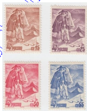
Rys. 11. Zakopane FIS - 1939 Fig. 11. Zakopane FIS - 1939