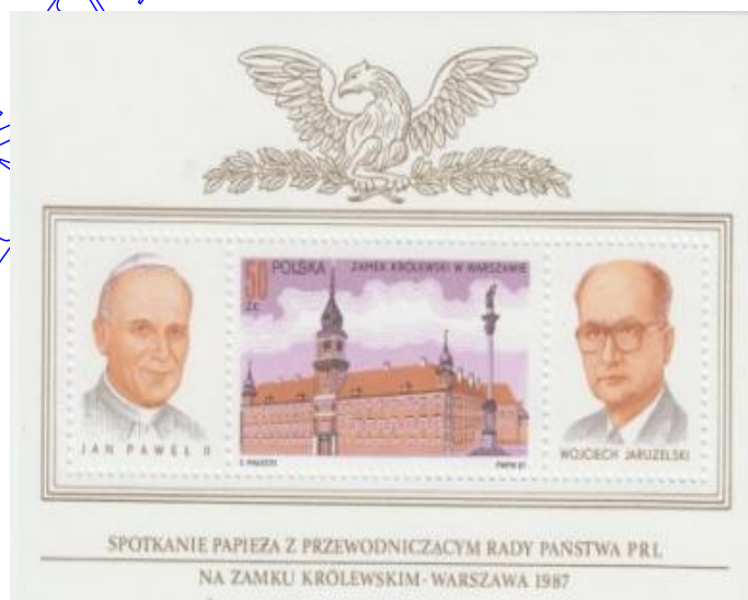
Rys. 24. Spotkanie Jana Pawła II z gen. Wojciechem Jaruzelskim

Znaczków z papieżem Janem Pawłem II Poczta Polska wydała dużo. Jest jednak jeden interesujący szczegół. Kilka emisji zostało wydrukowanych wspólnie z Poczta Watykańską. Jedną z tych emisji, to portret papieża wydrukowany na cienkiej srebrnej blaszce. Jest to jeden z niewielu, a może jedyny przypadek, kiedy znaczek pocztowy drukowany nie jest na papierze, lecz na srebrnej folii (rys. 25).