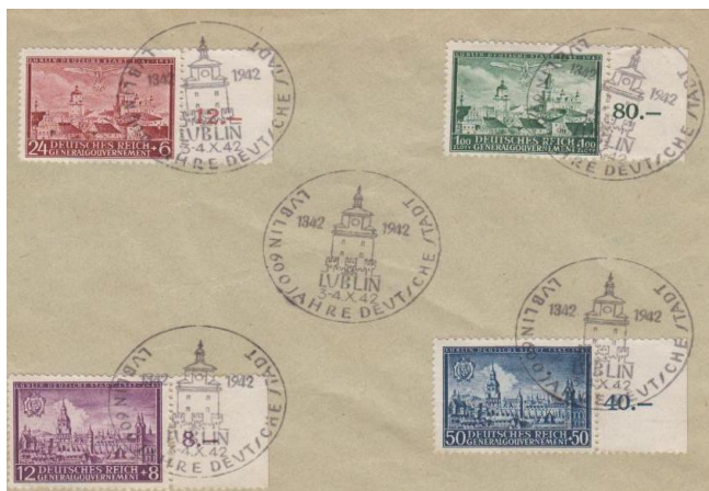
Rys. 17. Niemiecki Lublin