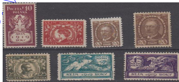
Rys. 7. Pierwszy Sejm II Rzeczypospolitej Fig. 7. The first Parliament of Second Polish Republic

Okres II Rzeczypospolitej w historii naszego kraju to bardzo trudny okres. Należało scalić w jeden organizm państwowy trzy różne tereny zaborów. Ustanowić nowe władze, wywalczyć bezpieczne granice. Zniszczenia wojenne były ogromne. Nie brakowało jednak dużych osiągnięć, z których możemy być dumni. Od podstaw powstał w Polsce przemysł lotniczy. Byliśmy światową potęgą w produkcji małych samolotów sportowych. Nasi piloci odnosili na nich wielkie sukcesy, wśród nich tak ważne nazwiska jak: F. Żwirko i S. Wigura, czy też J. Bajan i G. Pokrzywka. Ich sportowe wyczyny zostały upamiętnione na seriach znaczków wydanych przed II Wojną Światową (rys. 8a) i w roku 1982 (rys. 8b).