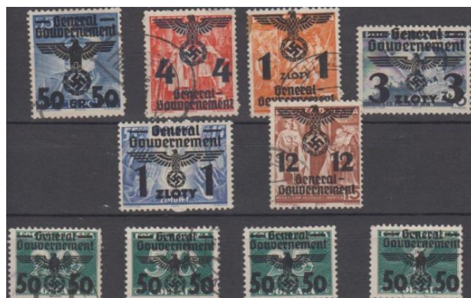
Rys. 16. Pierwsze znaczki GG Fig. 16. The first stamps of German-occupied Poland

W 1942 roku Niemcy znaleźli jakoby dokument, że w 1342 roku Lublin otrzymał prawa miejskie na prawie magdeburskim. Fakt ten należało wykorzystać propagandowo. Ukazała się seria znaczków Generalnej Guberni z historycznymi i współczesnymi panoramami miasta „Niemieckiego Lublina”. W Lublinie w urzędach pocztowych znaczki te były stemplowane okolicznościowymi stemplami (rys. 17).