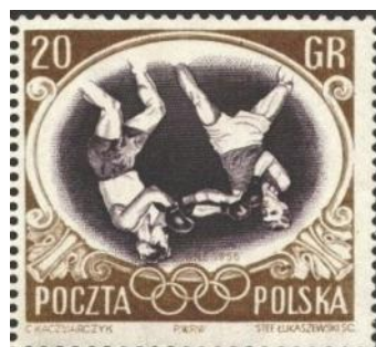
Rys. 32. Najdroższy znaczek PRL Fig. 32. The most expensive stamp of Polish People's Republic