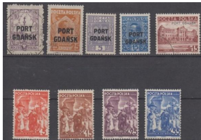
Rys. 12. Polska Poczta w Gdańsku Fig. 12. Polish Post in Gdansk

W okresie międzywojennym ukazywały się znaczki przedstawiające różne wydarzenia z historii Polski, krajobrazy i zabytki architektoniczne. W roku 1938 przypadła rocznica dwudziestolecia Odzyskania Niepodległości. Z okazji tego tak ważnego wydarzenia Polska Poczta wydała serię znaczków, na których były przedstawiane istotne wydarzenia historyczne. Wydawałoby się, że to nic takiego nadzwyczajnego, gdyby nie znaczek o nominale 15 gr., na którym są postacie Królowej Jadwigi i Króla Władysława Jagiełły,