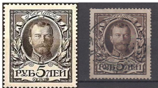
Rys. 29. Największy nominal znaczka rosyjskiego

Najwyższy nominal na polskim znaczku, to znaczek z serii z 1924 roku – 2 000 000 marek. Znaczek na rysunku 30 jest stemplowany a na odwrocie ma pieczętkę eksperta Polskiego Związku Filatelistów.