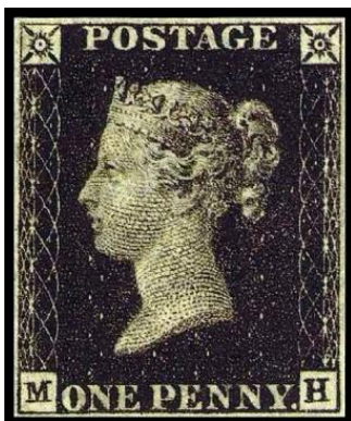
Rys. 1. Pierwszy znaczek świata Fig. 1. The first stamp of world

Pierwszy znaczek Polski wydał Zarząd Autonomii Królestwa Polskiego, 1 stycznia 1860 roku. Znaczek ten był wzorowany na znaczku rosyjskim z polskim napisem „ZA ŁÓD KOP. 10.”, ale w odróżnieniu od znaczka rosyjskiego posiadał ząbkowanie (rys. 2). Nakład znaczka wyniósł 3 000 000 egzemplarzy. Znaczki te służyły do korespondencji w ówczesnych granicach Królestwa Polskiego oraz do opłaty za przesyłki z Królestwa za granicę (Goszczyński 1977). Był używany do 1865 roku. Na terenach pozostałych zborów obowiązywały opłaty pocztowe poczt zaborców.