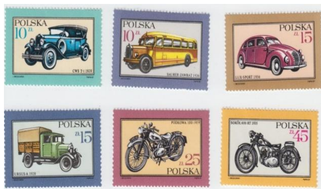
Rys. 9. Polska motoryzacja przed II Wojną Światową Fig. 9. The Polish Motorization before II World War

Ostatnią serię, jaką wydała Polska Poczta przed wybuchem II Wojny Światowej był komplet czterech znaczków poświęconych mistrzostwom narciarskim FIS, które odbyły się w Zakopanem na początku 1939 roku. Moim zdaniem jest to najładniejsza emisja II Rzeczypospolitej (rys. 11).