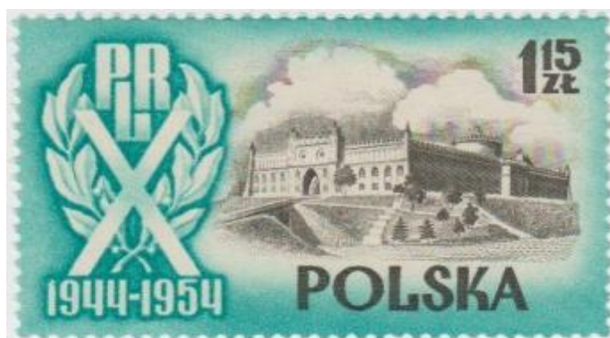
Rys. 22. Zamek w Lublinie