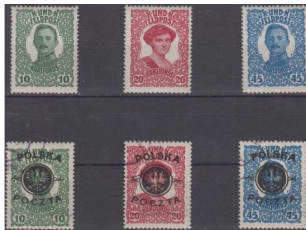
Rys. 5. Znaczki okupacyjne i przedruk tzw. lubelski Fig. 5. The occupation stamps and Lublin surcharge