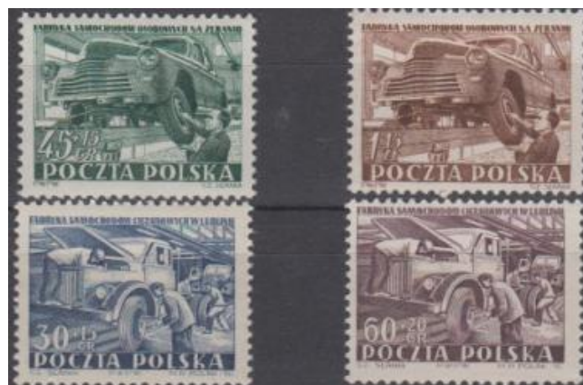
Rys. 21. Polska motoryzacja w PRL