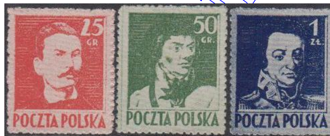
Rys. 19. Pierwsze znaczki z 1944 roku

Do 1954 roku polskie znaczki związane są przede wszystkim z tematyką propagandową chwalcą budowę socjalizmu (rys. 21). Na wielu z nich mamy portrety Bieruta lub innych przywódcach komunistycznych. Rekord biją znaczki drukowane do późnych lat osiemdziesiątych XX wieku, związanych z Leninem.