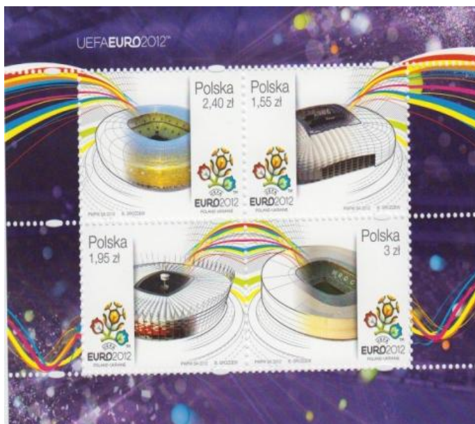
Rys. 26. EURO 2012

Kończąc ten krótki przegląd historyczny nie można zapomnieć o ostatniej wielkiej imprezie sportowej w Polsce, jaką było EURO 2012 (rys. 26).