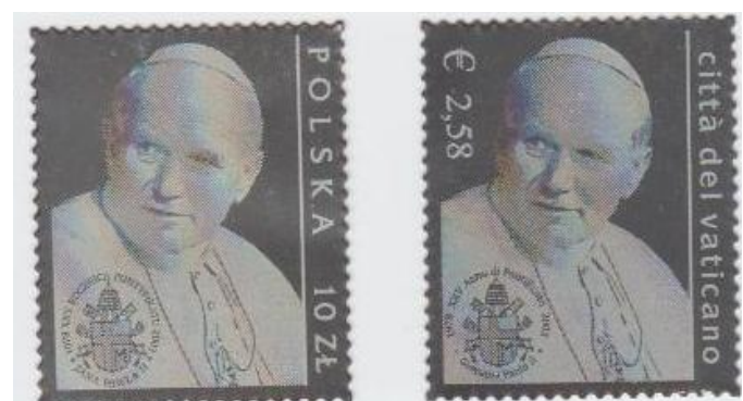
Rys. 25. Wspólna emisja Poczty Polskiej i Poczty Watykańskiej