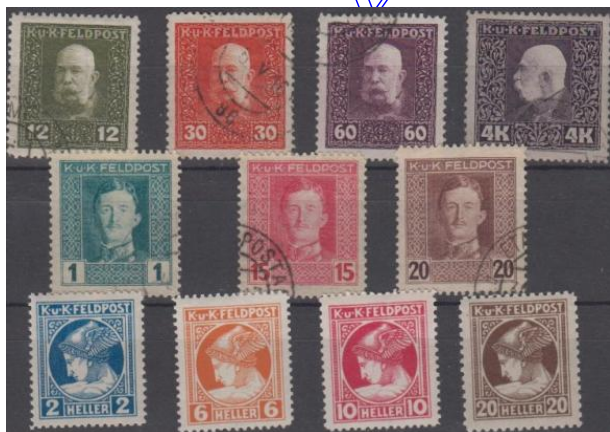
Rys. 4. Austriackie znaczki okupacyjne. Fig. 4. The Austria occupation stamps