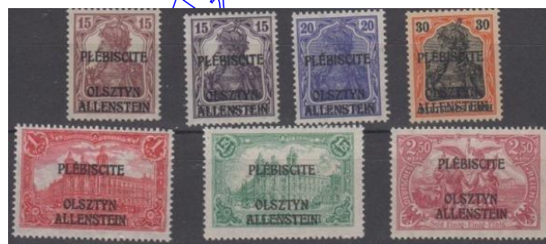
Rys. 6. Znaczki plebiscytowe na Warmii i Mazurach Fig. 6. The plebiscite stamps in Varmia and Masuria