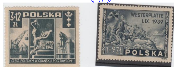
Rys. 14. Wrzesień 1939 Fig. 14. September 1939

1 września 1939 roku Niemcy Hitlerowskie napadają na Polskę. Wszystko zaczyna się od Gdańska. W Gdańsku broni się Poczta Polska, a przede wszystkim przez tydzień trwa obrona Westerplatte. Wydarzenia te nie mogą być pominięte w emisji znaczkowej. Poczta Polska po odzyskaniu niepodległości wydaje dwa znaczki poświęcone bohaterskim obrońcom (rys. 14).