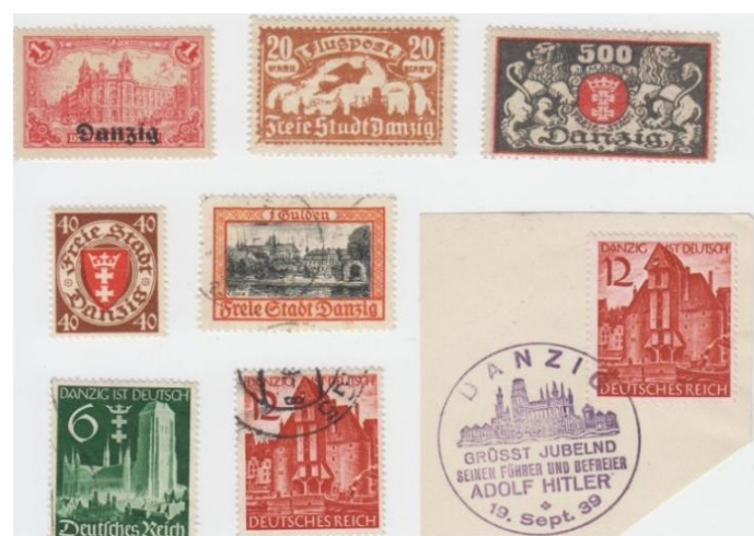
Rys. 13. Znaczki Wolnego Miasta Gdańsk Fig. 13. The stamps of Free Town Danzig

1 września 1939 roku Niemcy Hitlerowskie napadają na Polskę. Wszystko zaczyna się od Gdańska. W Gdańsku broni się Poczta Polska, a przede wszystkim przez tydzień trwa obrona Westerplatte. Wydarzenia te nie mogą być pominięte w emisji znaczkowej. Poczta Polska po odzyskaniu niepodległości wydaje dwa znaczki poświęcone bohaterskim obrońcom (rys. 14).