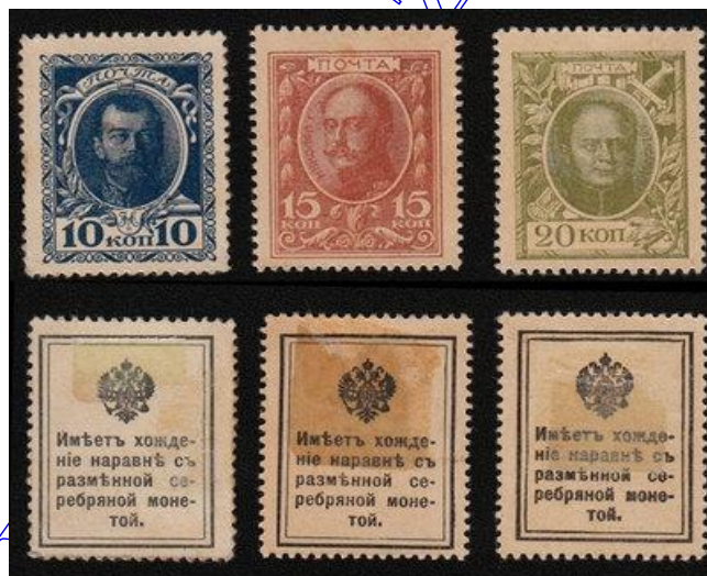
Rys. 28. Znaczko-monety Rosji

W czasie I Wojny Światowej w Rosji zaczęło brakować metali kolorowych, potrzebnych do produkcji wojennej. Poczta rosyjska, jako jedyna chyba na świecie wydrukowała znaczko-monety. Mogły one służyć do opłat pocztowych, ale również zastępowały monety, za które można było dokonywać zakupów (rys. 28).