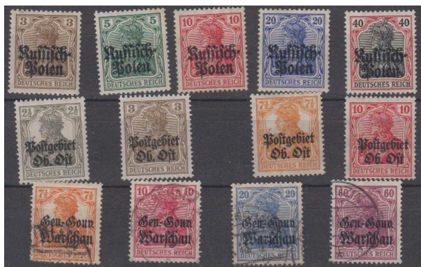
Rys. 3. Niemieckie znaczki okupacyjne Fig. 3. The German occupation stamps

Najważniejszą rzeczą po odzyskaniu niepodległości było ustanowienie nowych polskich władz państwowych, a także zwołanie sejmu ustawodawczego, który takie władze by powołał i przystąpił do opracowania nowej konstytucji. Nie możemy zapominać, że w Wersalu odbywała się konferencja pokojowa, a żadna z granic odrodzonego państwa nie była ostatecznie ustanowiona. Mimo tych niesprzyjających okoliczności, w 1919 roku zebrał się w Warszawie pierwszy Sejm II Rzeczypospolitej. To tak ważne dla Polski wydarzenie nie mogło się obyć bez tego, żeby nie upamiętnić go w postaci okolicznościowej serii znaczków (rys. 7).