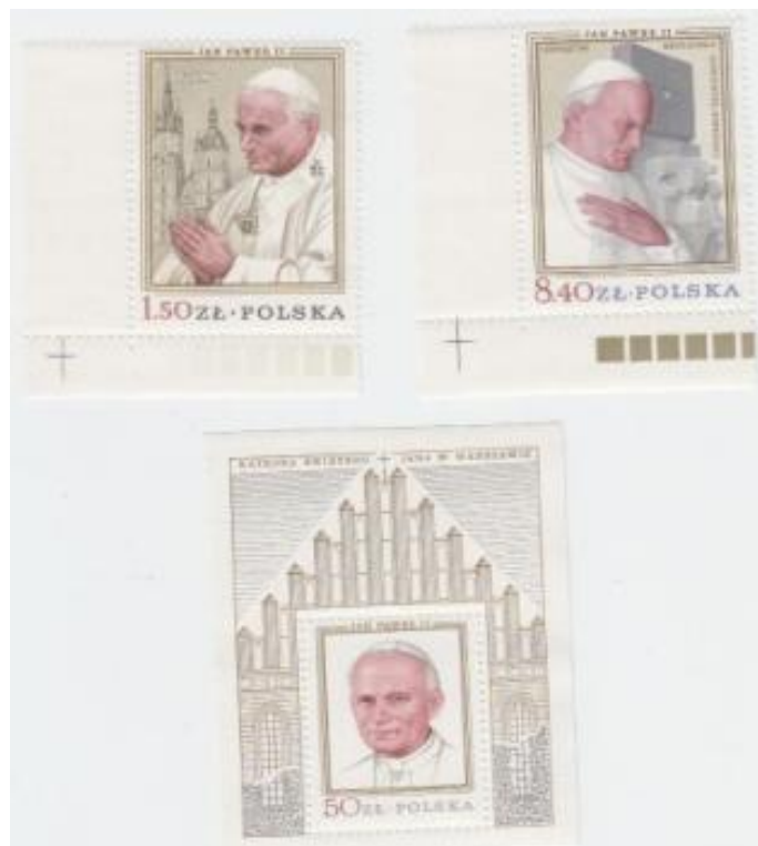
Rys. 23. Pierwsza wizyta Jana Pawła II w Polsce

Zamek lubelski nie jest żadnym szczególnym zabytkiem architektonicznym. Został zbudowany w latach dwudziestych XIX wieku przez gen. Józefa Zajączka, ówczesnego Namiestnika Królestwa Polskiego, z przeznaczeniem na więzienie. Jako więzienie funkcjonował przez długie lata. W okresie okupacji hitlerowskiej był jednym z najcięższych więzień gestapo. Kto trafił na „zamek” to kończył na Majdanku, Oświęcimiu lub po prostu był mordowany. Na dzień przed wyzwoleniem Lublina, hitlerowcy wymordowali wszystkich więźniów (ponad 200 osób). Przez następne dwa lata był więzieniem NKWD, bratniej ręce gestapo. Nic się nie zmieniło. Znowu tortury i ciche mordy polskich patriotów. Następnie zamek przechodzi w ręce UB. Wszystko toczy się dalej. Ilu Polaków zostało zamordowanych na zamku lubelskim nikt nie wie. Komuniści nie prowadzili w odróżnieniu od Niemców skrupulatnej kartoteki więźniów. W tym czasie dla mieszkańców Lublina „zamek” budził zgrozę. Po śmierci Stalina, gdy zbliżała się rocznica PRL więzienie na zamku zlikwidowano.