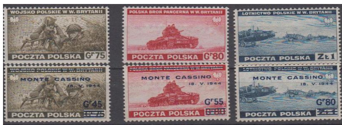
Rys. 18. Polskie znaczki w Wielkiej Brytanii

W latach II Wojny Światowej nie przestało funkcjonować Państwo Polskie. Już w październiku 1939 roku, w Paryżu, został powołany Rząd Polski na Uchodźstwie, zwany później Rządem Emigracyjnym. Funkcjonowały wszystkie organy władzy państwowej. Był urzędujący Prezydent Rzeczypospolitej Polskiej, Premier Rządu, Naczelnny Wódz, Wojsko Polskie, no i oczywiście nie mogło zabraknąć Poczty Polskiej. Po klęsce Francji, w 1940 roku, władze emigracyjne ewakuowały się do Wielkiej Brytanii. Poczta Polska już na terenie Wielkiej Brytanii wydała pierwszą emisję znaczków (rys. 18).