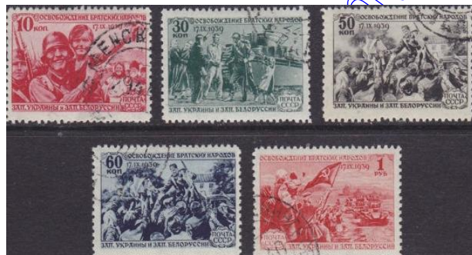
Rys. 15. Agresja Związku Radzieckiego na Polskę 17 września 1939 Fig. 15. Aggression of Soviet Union on Polish 17 September 1939

sień 1939 to również „bratnia pomoc” Armii Czerwonej, która jak bandyta 17 września napada z tyłu na Polskę, nazywając to „oswobodzeniem Zachodniej Ukrainy i Białorusi”. W państwie Stalina, taki krok nie może nie zostać uwieczniony. Zostaje więc wyemitowana odpowiednia seria znaczków (rys. 15).