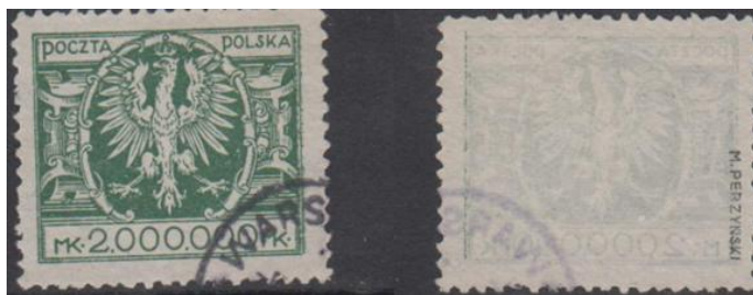
Rys. 30. Największy nominał znaczka polskiego Fig. 30. The greatest charge of Polish stamp

Na koniec chciałbym pokazać najdroższe znaczki polskie i zagraniczne. Ich wartości są uzależnione przede wszystkim od rzadkości występowania. Najdroższym znaczkiem polskim jest krakowski nadruk na austriackim znaczku dopłaty o nominale 10 koron. Wiadomo, że takich nadruków było 16. Jeden, pięknie zachowany z oryginalnym klejem, znajduje się w Muzeum Poczty i Telekomunikacji we Wrocławiu (rys. 31). Orientacyjna wartość tego znaczka to 1 mln złotych. Nic nie wiadomo o pozostałych znaczkach.