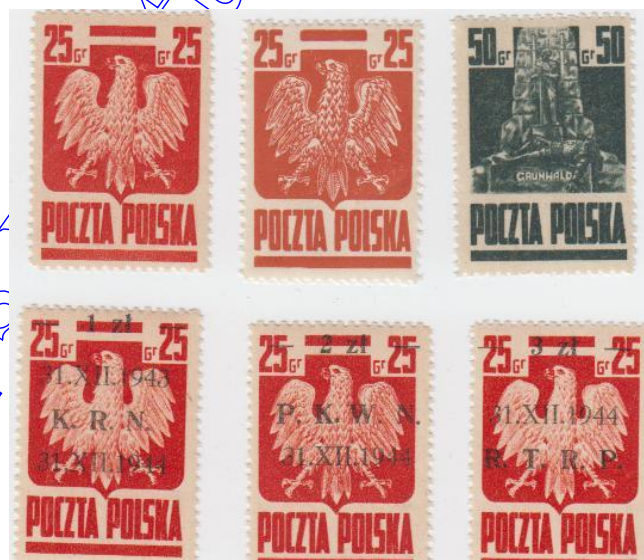
Rys. 20. Znaczki polskie wydrukowane w Moskwie