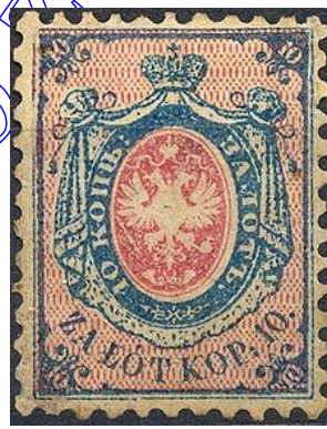
Rys. 2. Pierwszy znaczek Polski Fig. 2. The first stamp of Poland