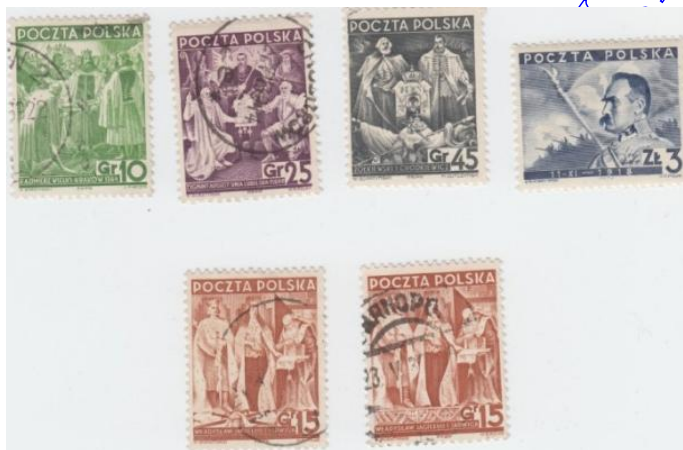
Rys. 10. Seria historyczna Fig. 10. Historical issue

W okresie międzywojennym ukazywały się znaczki przedstawiające różne wydarzenia z historii Polski, krajobrazy i zabytki architektoniczne. W roku 1938 przypadła rocznica dwudziestolecia Odzyskania Niepodległości. Z okazji tego tak ważnego wydarzenia Polska Poczta wydała serię znaczków, na których były przedstawiane istotne wydarzenia historyczne. Wydawałoby się, że to nic takiego nadzwyczajnego, gdyby nie znaczek o nominale 15 gr., na którym są postacie Królowej Jadwigi i Króla Władysława Jagiełły,